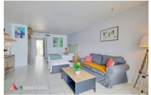
Studio meubl de 39 m? avec vue mer Mont Vernon

Situ dans le secteur pris de Mont Vernon, ? quelques minutes ? pied de la magnifique plage d'Orient Bay, dcouvrez ce beau studio de 39 m?, enti?rement meubl, en tage, avec une superbe vue mer.